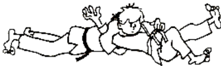
KUZURE-KAMI-SHIHO-GATAME VARIANTE DU CONTRÔLE ARRIÈRE STERNAL