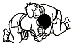
RETOURNER, DANS 2 POSITIONS DE DEPART DIFFÉRENTES, UKÉ À 4 PATTES