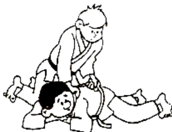
RETOURNER UKÉ À PLAT VENTRE