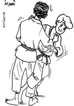
O SOTO-OTOSHI GRAND RENVERSEMENT EXTÉRIEUR