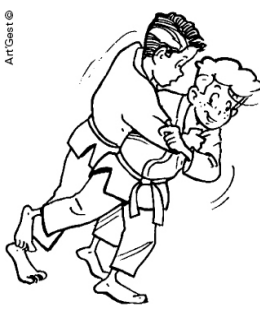
HARAI-GOSHI BALAYAGE DE LA HANCHE