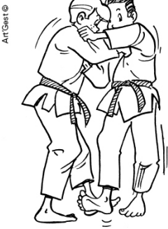
DE-ASHI-BARAI BALAYAGE DU PIED AVANCÉ