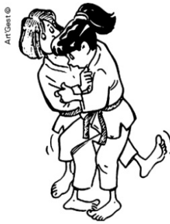
O SOTO-GARI GRAND FAUCHAGE EXTÉRIEUR