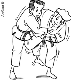
UCHI-MATA FAUCHAGE INTÉRIEUR DE LA CUISSE