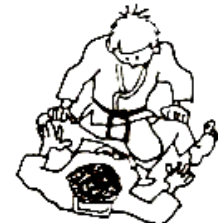
FRANCHIR LES JAMBES D'UKE