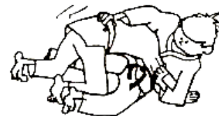
ATTAQUER AVEC UKE ENTRE LES JAMBES