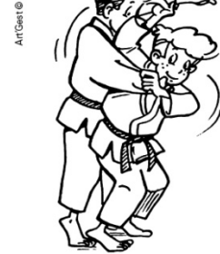
SODE-TSURIKOMI-GOSHI HANCHE PÉCHÉE EN SOULEVANT LE COUDE