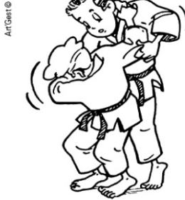
TSURI-KOMI-GOSHI PROJECTION DE HANCHE EN PÉCHANT