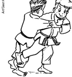
ASHI-GURUMA ENROULEMENT AUTOUR DE LA JAMBE