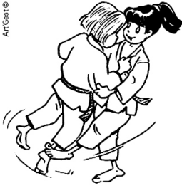
OKURI-ASHI-BARAI BALAYAGE DES DEUX PIEDS