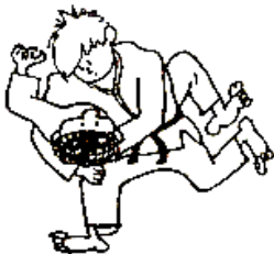
MAKURA-GESA-GATAME CONTRÔLE LATERO-COSTAL EN OREILLER