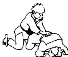
RETOURNER UKE A 4 PATTES : de face, de côté, à cheval