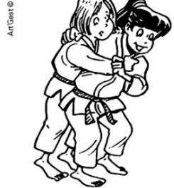
KOSHI-GURUMA ENROULEMENT DE LA HANCHE