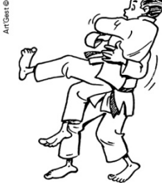
USHIRO-GOSHI CONTRE DE HANCHE ARRIÈRE